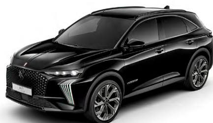
Čierna PERLA NERA (P)