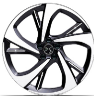
Zliatinové disky 20" TOKYO (ZHFK) voliteľná výbava pre PALLAS, ÉTOILE (okrem PLUG-IN HYBRID 360 k 4x4)