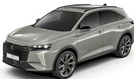
Sivá LAQUÉ (M)