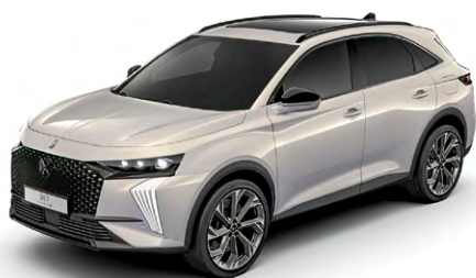
Sivá CRISTAL PEARL (P)