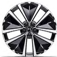
Zliatinové disky 19" EDINBURGH (ZHWO) v sérii pre PALLAS, ÉTOILE, COLLECTION Antoine de Saint Exupéry a ÉDITION FRANCE