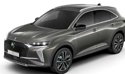
Sivá TITAN (M)