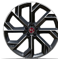
Zliatinové disky 21" BROOKLYN (ZHYA) v sérii pre PERFORMANCE 4x4 360k