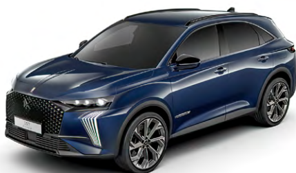
Modrá SAPHIR (M)